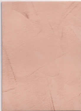
Daim JH 40ML - NH 5ML - RH 10ML