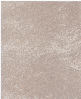
RS 500 Finition Colorado