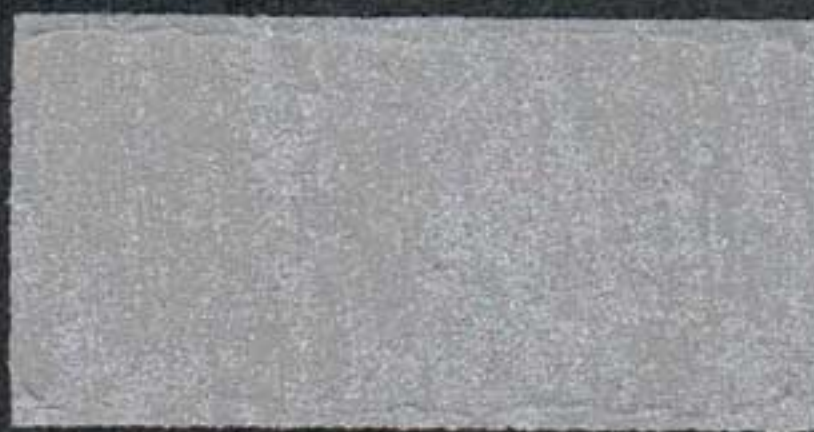
DARK2 Sous-couche JH 15 NH 10