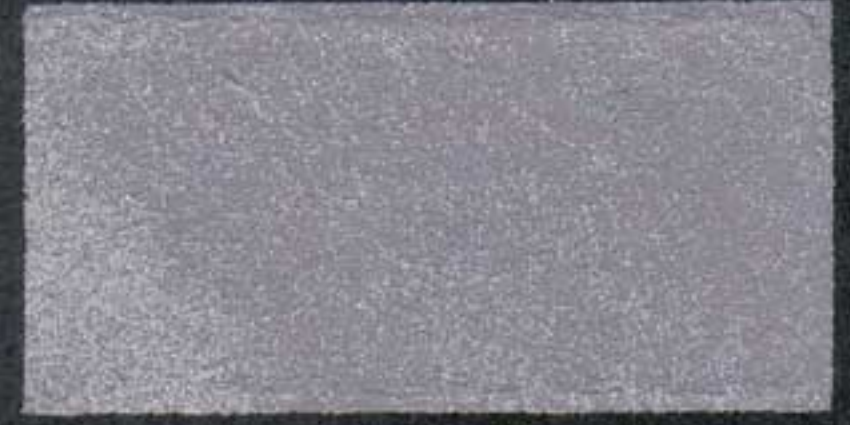
DARK5 Sous-couche NH 15 OV 5