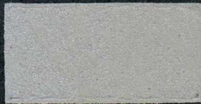
DARK9 Sous-couche JV 15 NH 5 VI 5