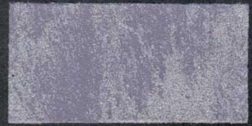
DARK8 Sous-couche NH 10 RV 20 BE 5