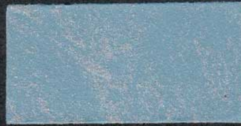
DARK10 Sous-couche BE 5 NH 10