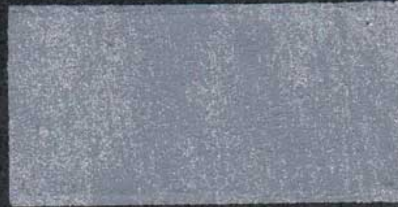
DARK7 NH 20