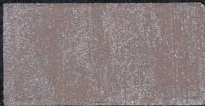
DARK6 Sous-couche JV 20 OV 20 NH 15