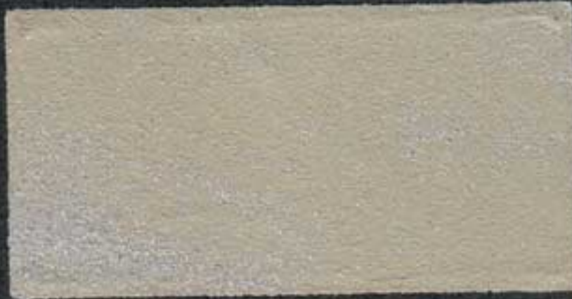
DARK4 JH 20 NH 5 PV 5