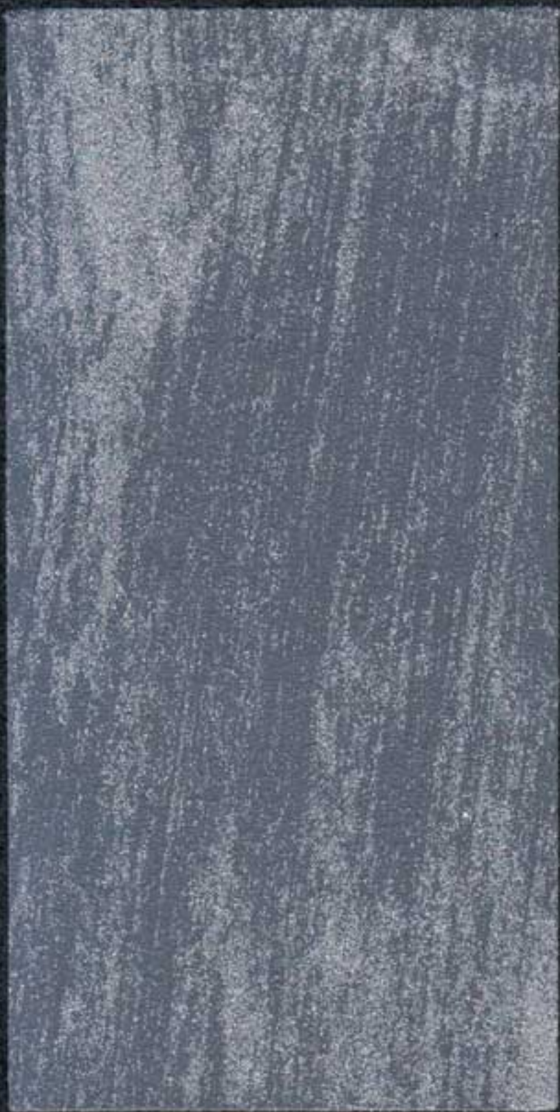
DARK1 Sous-couche NH 40 ML