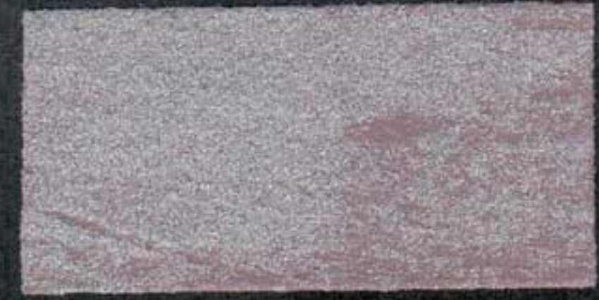
DARK11 Sous-couche JV 20 OV 20 NH 10