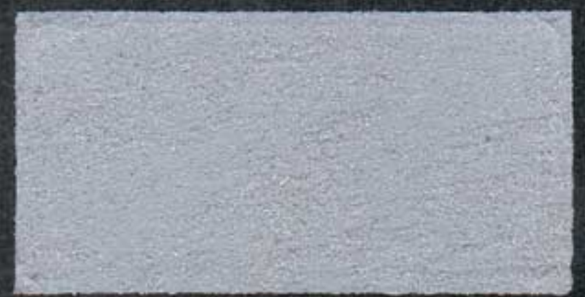
DARK3 Sous-couche NH 5